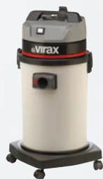
Απορροφητήρας νερού και σκόνης Κωδ. 050057