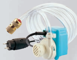
Αντλία νερού ηλεκτρική Κωδ. 050055