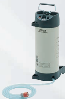
Αντλία νερού χειροκίνητη Κωδ. 050149