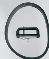
Βαλβίδα και φλάντζα βάσης.