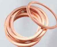
10 δακτύλιοι αντιμπλοκαρίσματος.