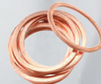
10 anilhas anti-bloqueio.