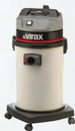
Aspirador de água e poeiras Ref. 050057

*Funciona apenas com brocas de ligação 1,1/4"