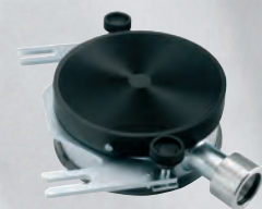
Recuperador de água