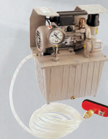
Pompa a vuoto Rif. 050043