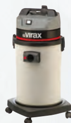
Aspiratore acqua e polveri Rif. 050057