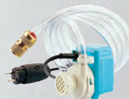
Pompa dell'acqua elettrica Rif. 050055