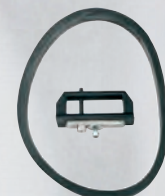
Otturatore e guarnizione telaio.