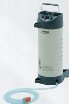
Pompa dell'acqua manuale Rif. 050049