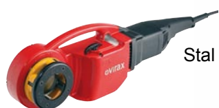
Stal BSPT lewe