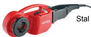
Stal BSPT prawe