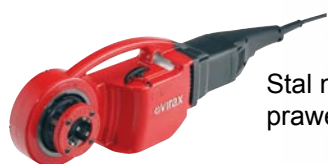
Stal nierdzewna BSPT prawe