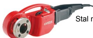
Stal nierdzewna NPT