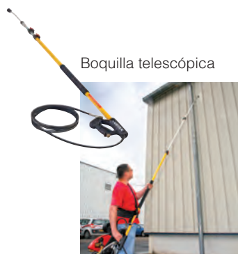
Arnés para Boquilla telescópica

* Funciona únicamente con la boquilla telescópica Ref. 293233.