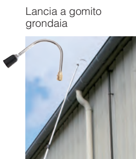
Lancia a gomito grondaia