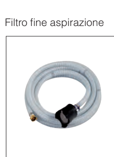
Filtro fine aspirazione