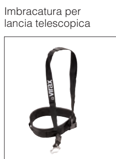
Imbracatura per lancia telescopica