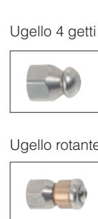
Ugello 4 getti