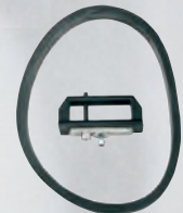
Afsluiter en pakking houder.