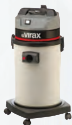
Water- en stofzuiger Ref. 050057