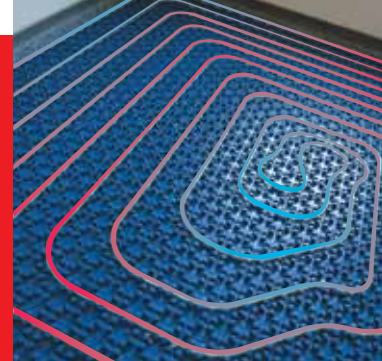
Nieskuteczne ogrzewanie podłogowe?