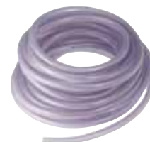
Przedłużenie elastyczne (20 m) Nr kat. 295022