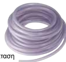
Εύκαμπτη προέκταση (20 μέτρα) Κωδικός 295022